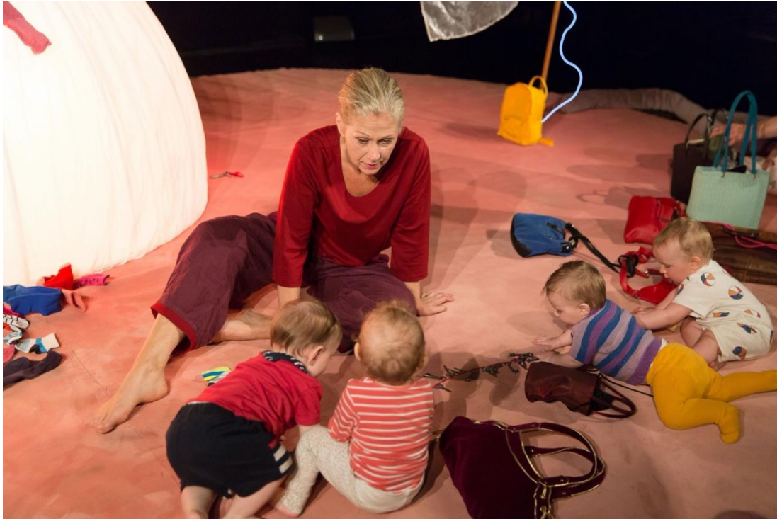
Efter föreställningen Bo. Vi diskuterar nycklar, väskor och andra viktiga saker i livet.

Kort om mig: Jag bor i Stockholm där jag också är född.