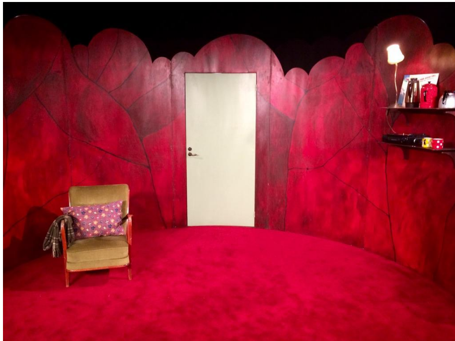
Rummet i föreställningen Bubbla, för bebisar 6–12 månader

Jag bad om en dörr i scenografen i mitten längst bak. Dörren blev en tacksam tittutlek, vem kommer och hälsar på? En händelse som hela föreställningen kunde byggas vidare på.